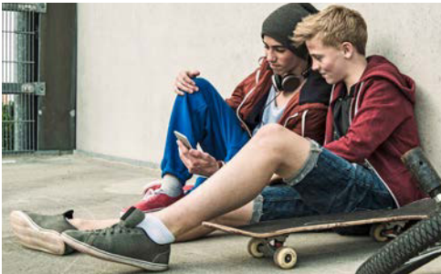
Das Ticket wird mit freundlicher Unterstützung des Landes Baden-Württemberg und des Landkreises Heidenheim angeboten.

Es gelten die Tarifbestimmungen des htv.